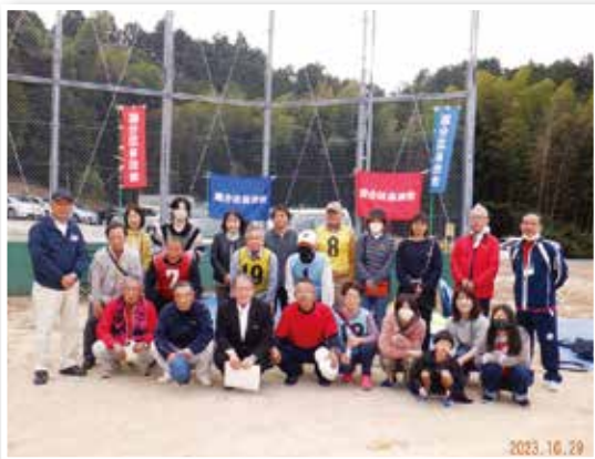
ペタンクカーニバル 国分チーム