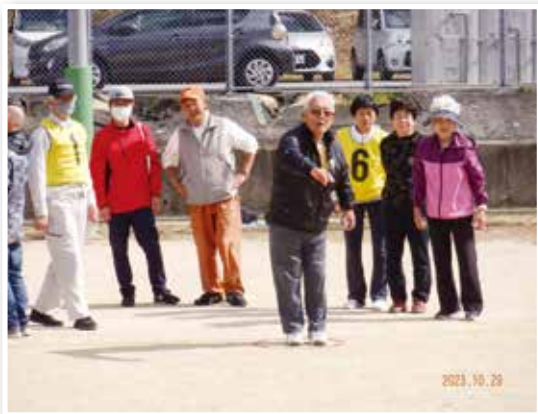
ペタンクカーニバル 準優勝チーム