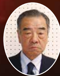
国分区自治会長 国分公民館長